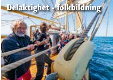
Delaktighet - folkbildning