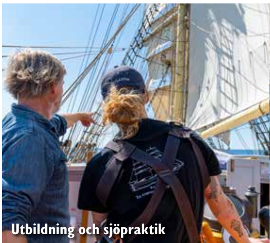
Utbildning och sjöpraktik