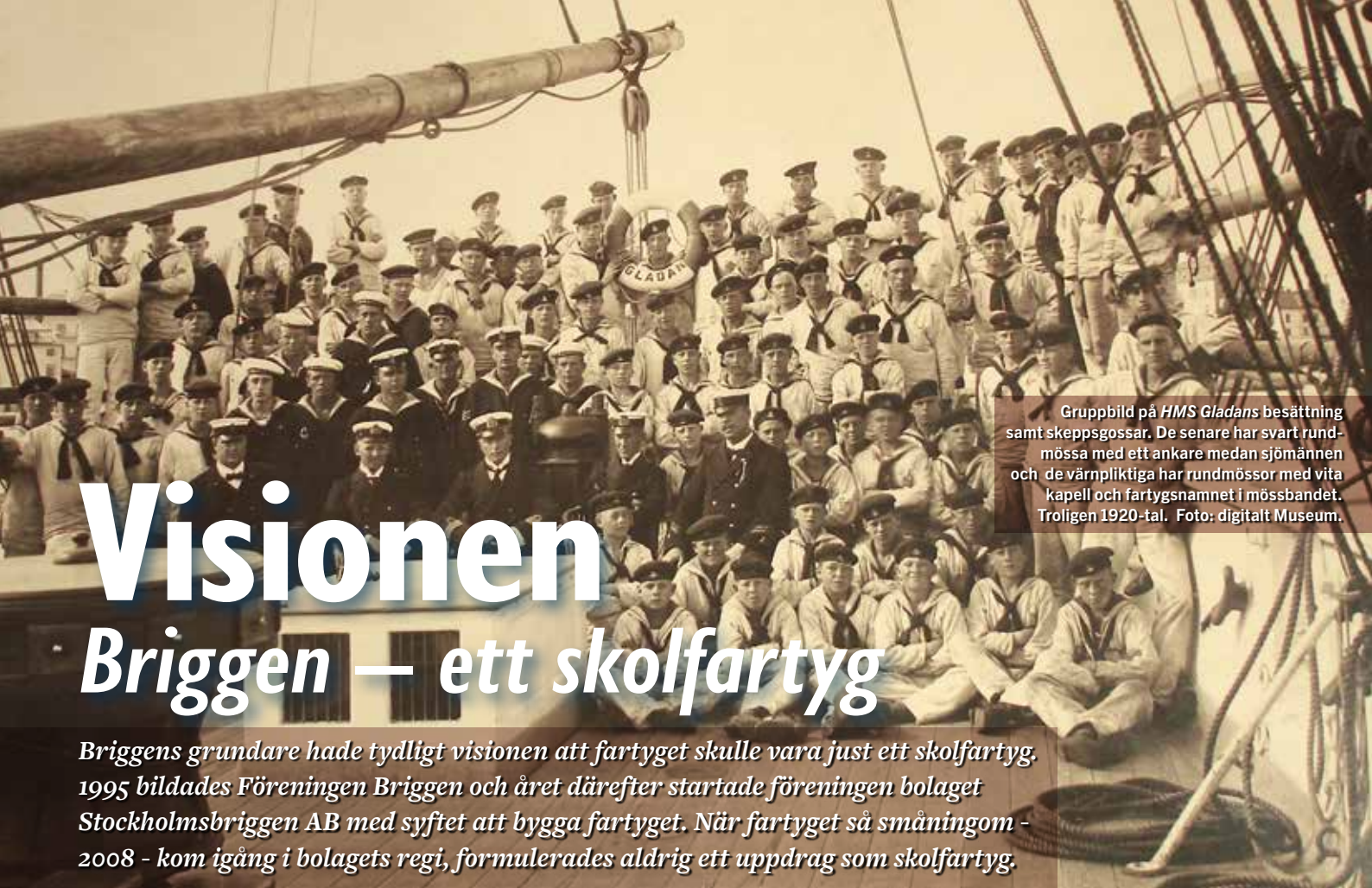
Gruppenbild på HMS Gladans besättning samt skeppsgossar. De senare har svart rundmössa med ett ankare medan sjömännen och de värnpliktiga har rundmössor med vita kapell och fartygsnamnet i mössbandet. Troligen 1920-tal.