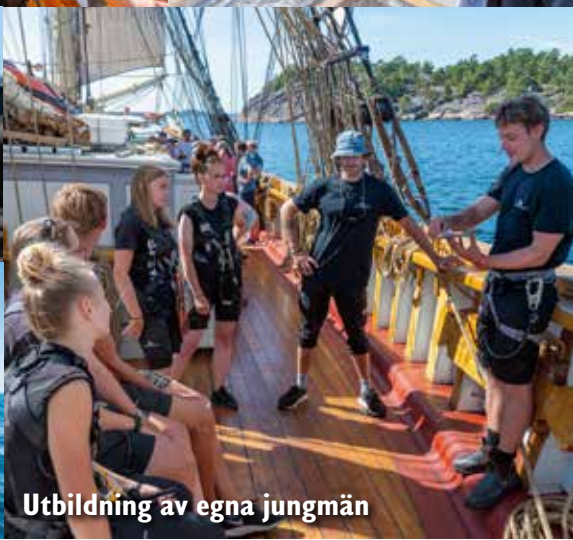
Utbildning av egna jungmän