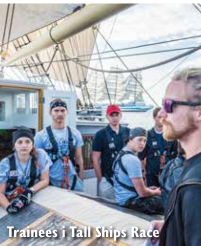
Trainees i Tall Ships Race