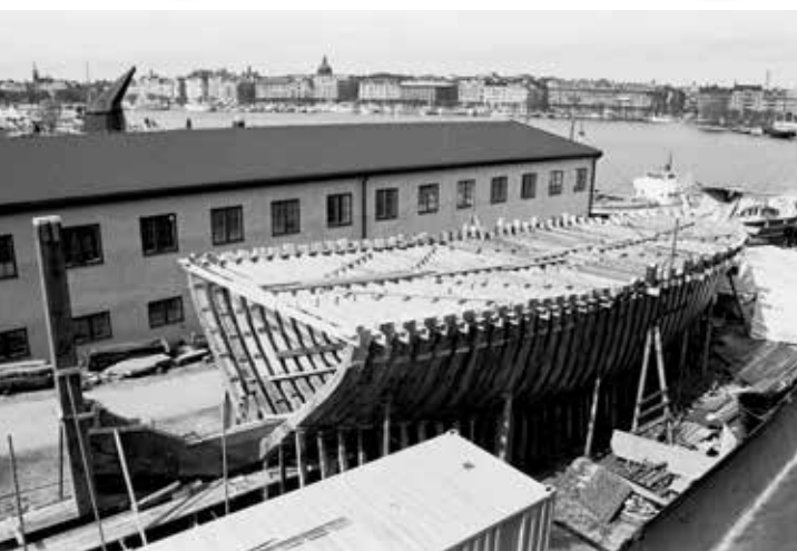
Byggplatsen på Skeppsholmen sommaren 2007. Stockholmsbriggen saknar fortfarande ett antal spant och akterskepp.

det platsen på Skeppsholmen i stället. Ett lyckokast då platsen var klassisk skeppsbygnadsmark, till lägre kostnad och dessutom en verkligt publik plats med många möjligheter.